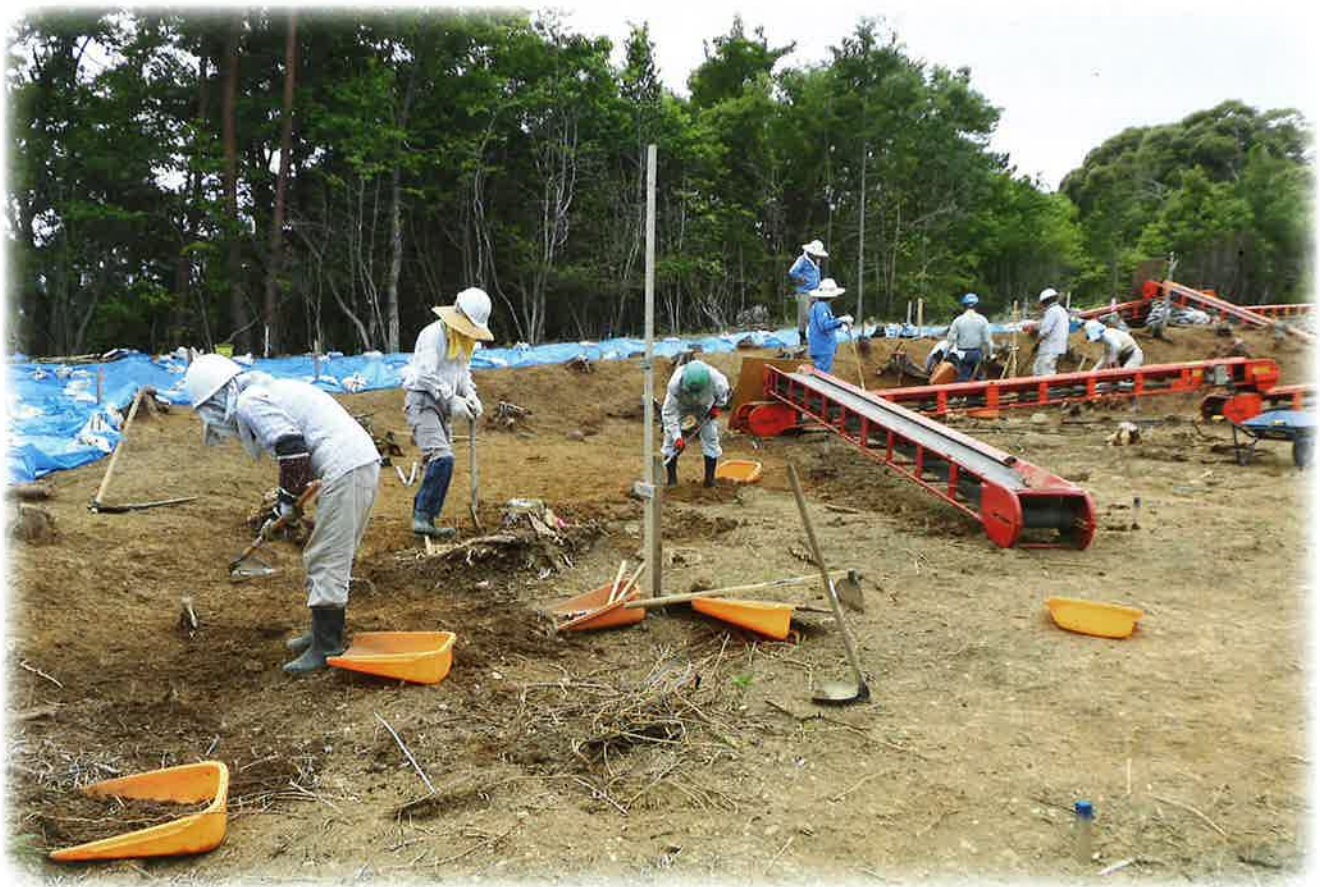
会員による田辺城跡遺跡発掘作業 東海環状自動車道建設予定地（いなべ市北勢町田辺地内）