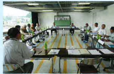
平成29年度 第1回 安全適正委員会