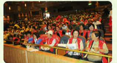
記念式典に参加された皆さん

親方は「土俵は人生の縮図」です。相撲というのは、はたかかれても、自分から前に出て勝ちに行くこと。引き手など人の力を利用して勝つことを覚えたら、いつまで経っても強くならない。人生も一緒なのです。皆さんが健康で元気でハツラツと前に向かって行くことによって、幸せをつかむことができ、体も元気になっていきます。シルバー年代ではありますますます頑張ってくださいとエールを送って頂きました。そして、巡業先で唄う相撲甚句を披露。「どの力士よりも私の方が一番上手です」と言って会場を沸かせ、美声を披露され講演を締めくくって頂きました。