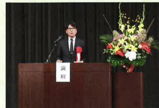
平井県シ連事務局長祝辞