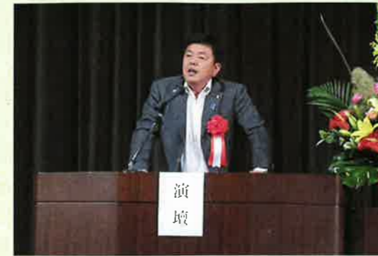
川瀬市議会議長祝辞