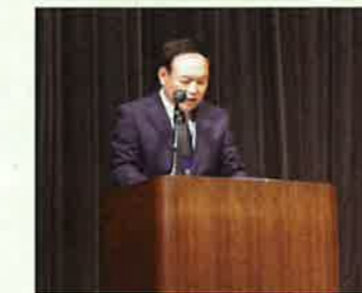
事務局からの説明