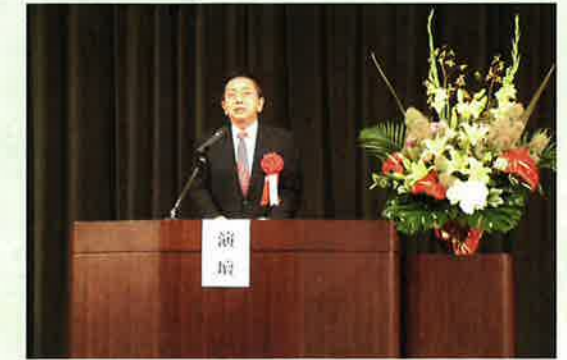
日沖県議会議員祝辞