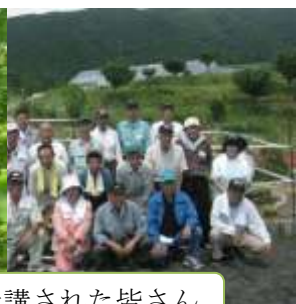
受講された皆さん