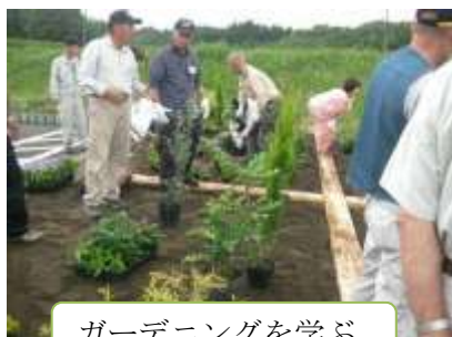
ガーデニングを学ぶ

厚生労働省委託事業の緑地管理・ガーデニング講習会がいなべ市農業公園で好評開催されました。樹木の剪定のほか刈払機の取り扱い講習会等、緑地の管理からガーデニングの基本的な知識や技能について初歩から応用まで充実した内容で研修しました。受講者は22名で5月21日（土）から6日間実施しました。