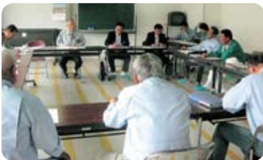
交通安全講習会風景

交通安全の講習会を開催し安全の意識を高め無事故、無違反の運転に努めてまいります。