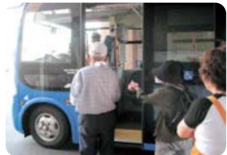
バスを利用される方がた