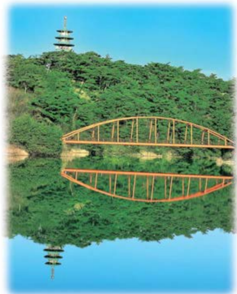
員弁公園の逆さ五重塔 (員弁公園・五重塔)

毎日の散歩に員弁公園へ出かけます。員弁大池にシンボルタワーが鏡のように映っていたので撮影しました。