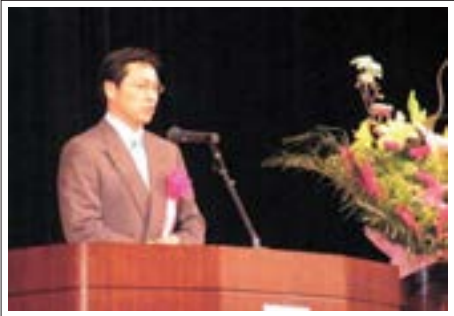
いなべ市 日沖市長の挨拶