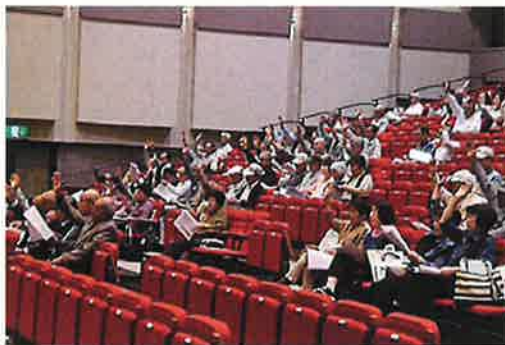
総会風景 (挙手多数で議案成立)