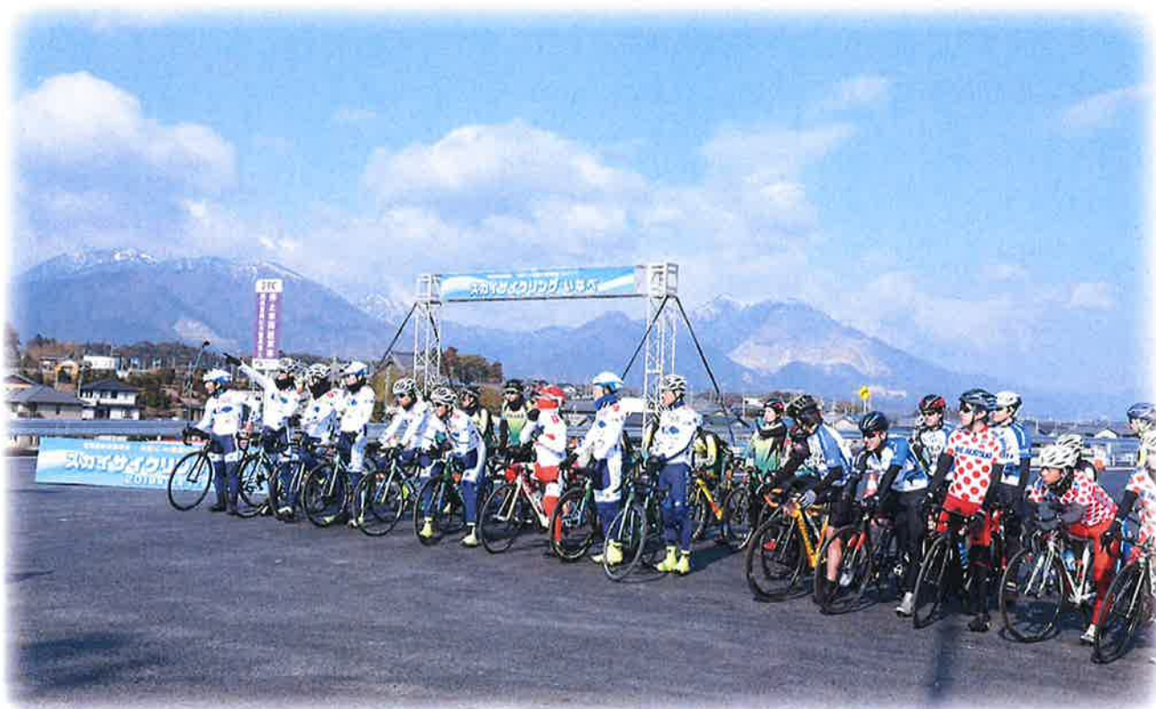
東海環状自動車道大安IC⇄東員IC開通記念イベント (スカイサイクリングいなべ)