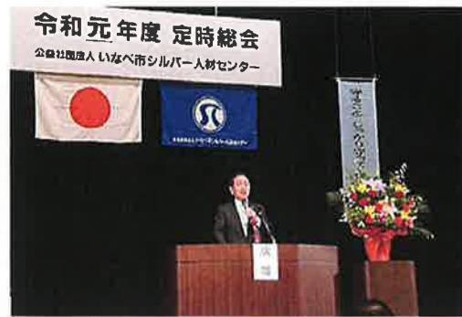
日沖県議会議員祝辞