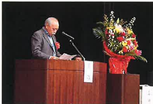
内田県シ連事務局長祝辞