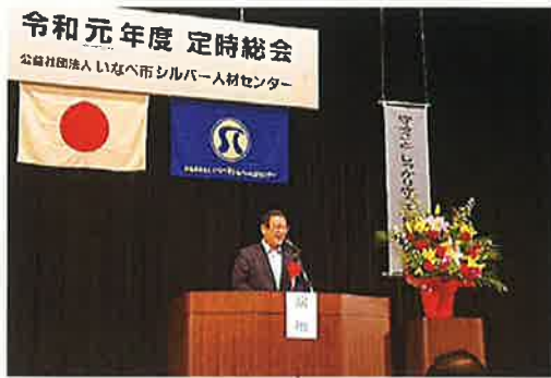
清水議会副議長祝辞