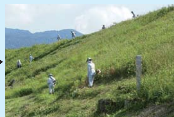
員弁町笠田大溜▶ 除草作業