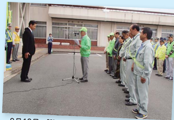
9月19日 「秋の交通安全運動」 出発式 (安全宣言)