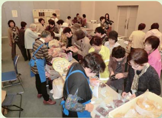
いきいきフェスタ2014