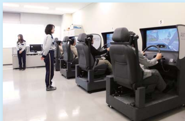
11月13日 交通マナー研修