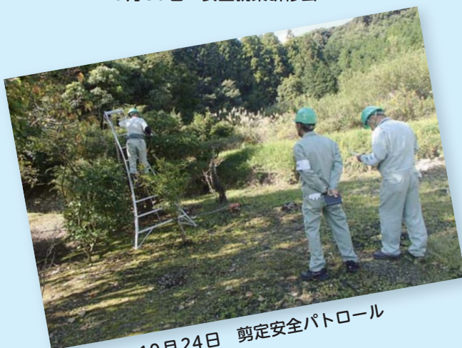
10月24日 剪定安全パトロール