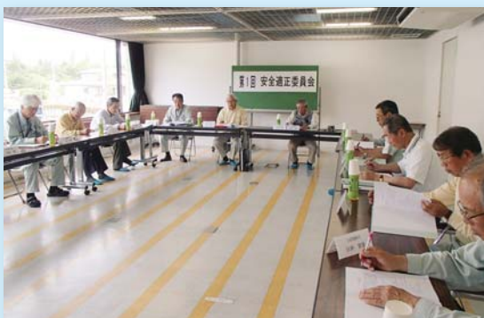
5月27日 第1回安全適正委員会

今年こそは、就業は安全確保最優先に徹して戴き無事故で乗り切り、そして充実した一年を皆様の人生に刻まれんことを衷心より祈念し、新年の挨拶とさせていただきます。