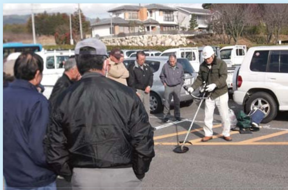
2月21日 刈払機講習会