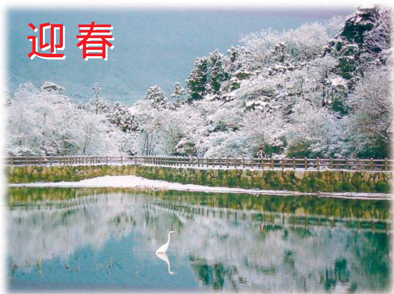
大安町鍋坂溜の雪化粧